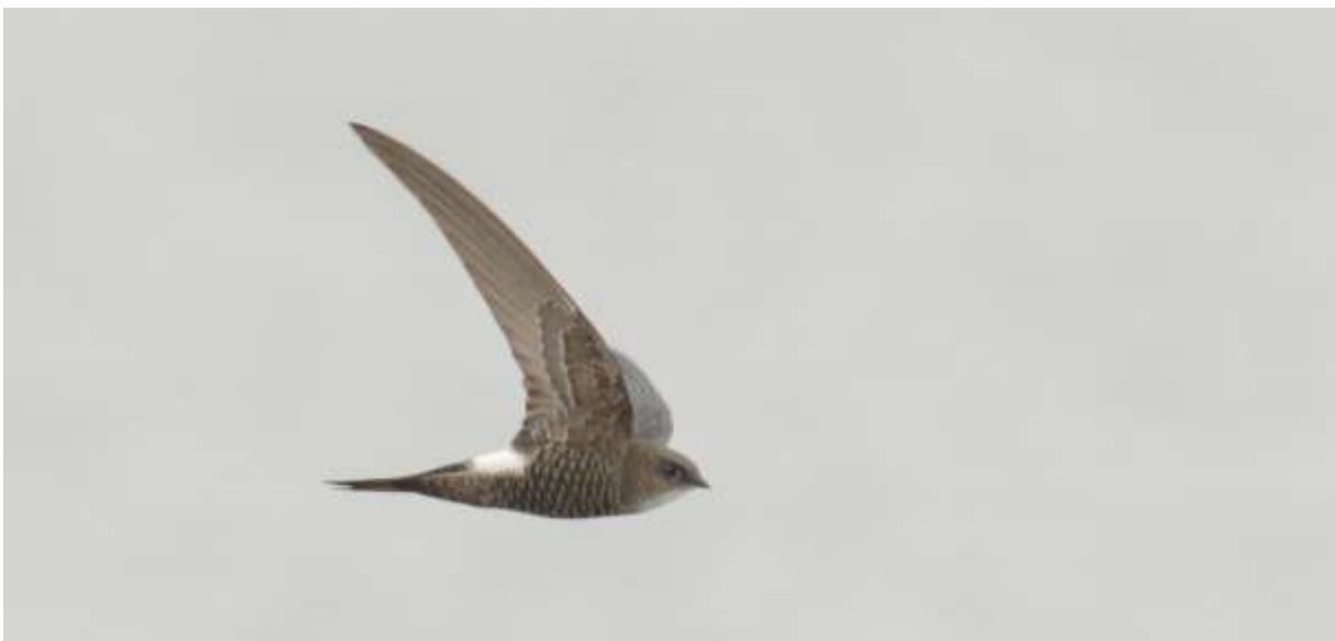
Pacific (Salim Ali) Swift, Flower Lake, Rouergai, Sichuan, China, 14 juni 2014, LS

We waren ineens ook een Chinese toeristische attractie want de groep werd uitgebreid op de foto gezet terwijl we de leeuweriken aan het bekijken waren! Pacific (Salim Ali) Swifts vlogen laag over het water en lieten zich zeldzaam mooi zien en fotograferen. Inmiddels was het flink aan het regenen en op de boardwalk naar de volgende hut liet een Strandleeuwerik zich nauwelijks van het pad jagen. De terugweg met de shuttlebus naar de parkeerplaats had nog een verrassing in petto: Benny zag een Saker op een van de paaltjes langs de weg! Toen we er eindelijk uit konden was ie met de scoop nog goed herkenbaar, teruglopen was echter niet mogelijk. De omgeving was prachtig met uitgestrekte rietvelden en graslanden, besneeuwde bergtoppen en Tibetaanse tempels. Overnachting in Ruergai.