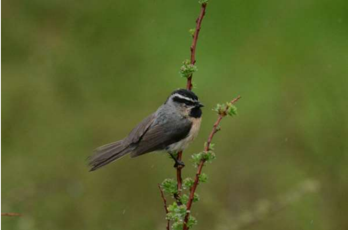
White-browed Tit, Tibetaans Plateau, Hong Yuan, Sichuan, China, 12 juni 2014, LS