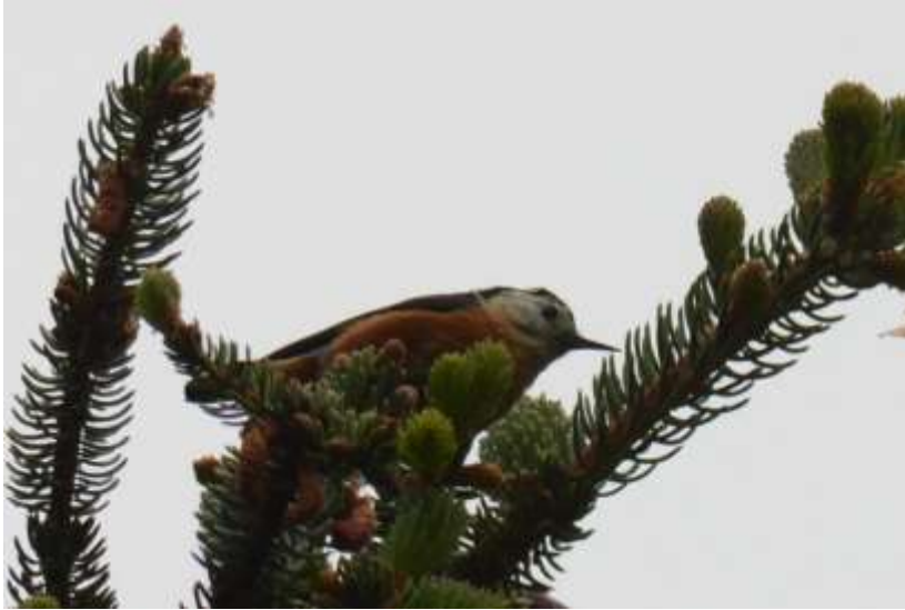
Przewalskis Nuthatch, Baxi Forest, Rouergai, Sichuan, China, 13 juni 2014, LS

Grey-crested Tit en enkele Chinese Leaf Warblers. Op een gegeven moment zag Jay een vogel hoog boven in de spar vliegen die zich even later fraai liet zien, een fraaie Przewalski's Nuthatch! Heel gaaf beest!