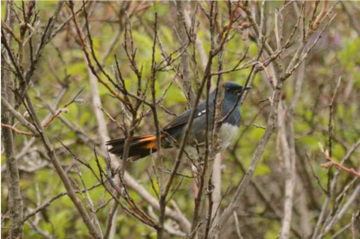
White-bellied Redstart, alpine zone tussen Rouergai en Jiuzhaigou, Sichuan, China, 15 juni 2014, LS

Het meeste hadden we inmiddels gezien zodat we niet weer heel vroeg naar Baxi Forest hoefden. We konden dus voor de verandering ontbijten in het hotel. De soort waar we vandaag naar op zoek gingen was Robin Accentor, een soort die zich ophoudt in het struikgewas op de boomgrens. Na een paar uur rijden waren we op de plek, een heuvelachtig terrein met struikgewas en grasland. We zagen al snel Grauwe Fitis, een prachtige White-bellied Redstart, Alpine Leaf Warbler maar ook White-browed Tit-Warbler (waar we er in totaal 6 van zouden zien hier...!).