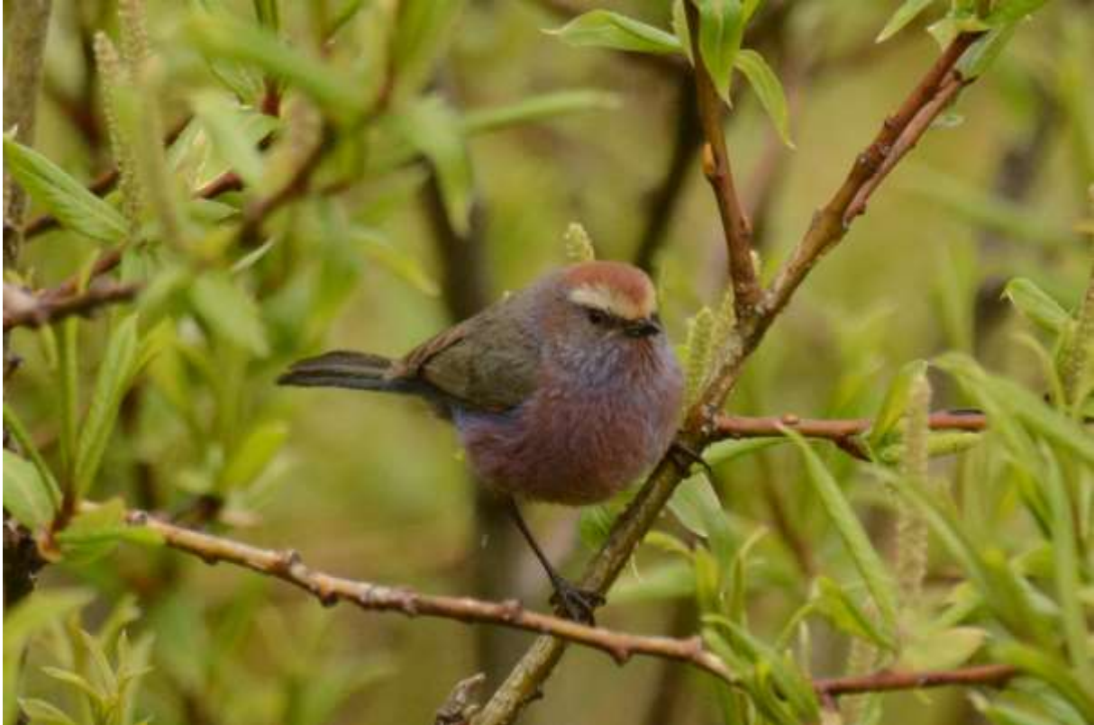
White-browed Tit-Wabler, alpine zone tussen Rouergai en Jiuzhaigou, Sichuan, China, 15 juni 2014, LS

Nog geen spoor van de Robin Accentor echter. Wel zaten er verschillende Rufous-breasted Accentors en dat zouden de enige accentors zijn die we tegen zouden komen. Maar het was toch een goed vogelgebied met enkele Beautiful Rosefinches, Siberische Roodborsttapuit, Rosy Pipits en Blue-fronted Redstarts. De volgende stop was in de middag en in hetzelfde gebied als Jiuzhaigou. In het coniferenbos langs de weg deden we een poging voor Sichuan Wood Owl die zich schijnbaar soms overdag laat zien. Die lukte helaas niet maar we vonden wel een Three-banded Rosefinch, een nieuwe soort! Pogingen voor Crested Tit-Warbler leverden een reeks aan Goudhanen en verschillende phyllo's op maar geen Tit-Warbler zodat we langzaam verder reden naar Jiuzhaigou. Het werd snel duidelijk dat dit één van de meest populaire attracties is in China, kilometers aan hotels passeerden we voordat we bij de onze aankwamen.