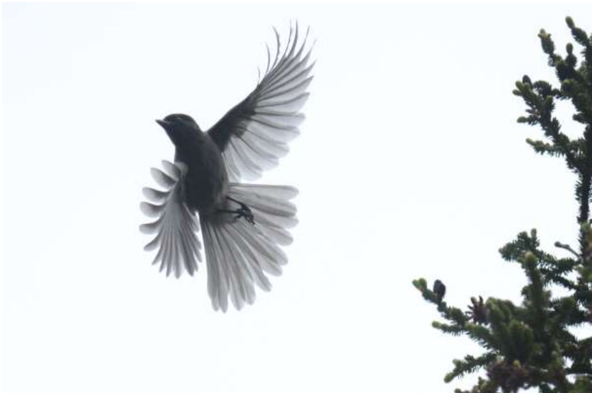
Sichuan Jay, Mengbi Shan, Sichuan, China, 11 juni 2014, LS

dichtheden zijn ook nog eens laag. We begonnen onze afdaling goed met Crimsom-browed Finch en Beautiful Rosefinch maar de activiteit was verder laag, waarschijnlijk vanwege de wind. Pas aan het einde van de ochtend kwam er weer wat leven, net toen de zon begon te schijnen en de wind wegviel. We hadden al een paar keer Sichuan Jay gehoord en de naaldbomen gescand toen er plotseling 3 vogels over kwamen vliegen, maar ook meteen uit beeld verdwenen. De soort was binnen maar een wat betere waarneming zou niet erg zijn...Vervolgens hoorden we dichtbij Blood Pheasants in het bos, Jay wenkte ons want zag ze lopen maar we waren net te laat. Jeanette zag vervolgens een vogel de weg oversteken, maar was helaas de enige. Een vreemd wat krassend geluid kwam uit de dennen en werd herkend als de roep van Sichuan Jay. Even later stonden we te kijken naar 2 vogels die zich uitgebreid lieten zien en fotograferen, wauw! Heel gaaf!