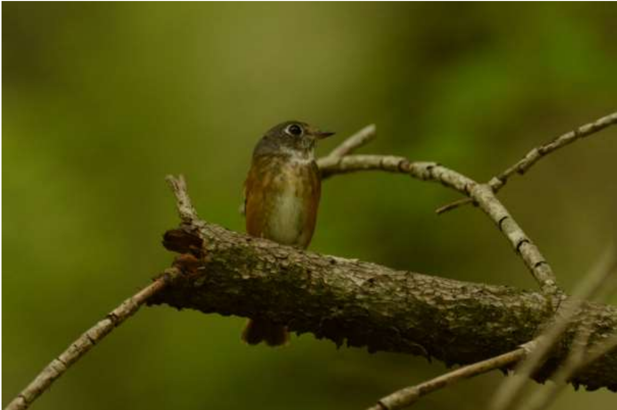
Ferruginous Flycatcher, Jiuzhaigou, Sichuan, China, 16 juni 2014, LS

was verder redelijk tam, de temperatuur liep aardig op – het was nog steeds mooi weer – zodat de activiteit beperkt bleef. Een zoektocht naar Sooty Tit leverde helaas niet het gewenste resultaat. Wel vonden we een paar Ferruginous Flycatchers en Rufous-bellied Niltava's die zich mooi lieten bekijken en een Brown Dipper bij de rivier.