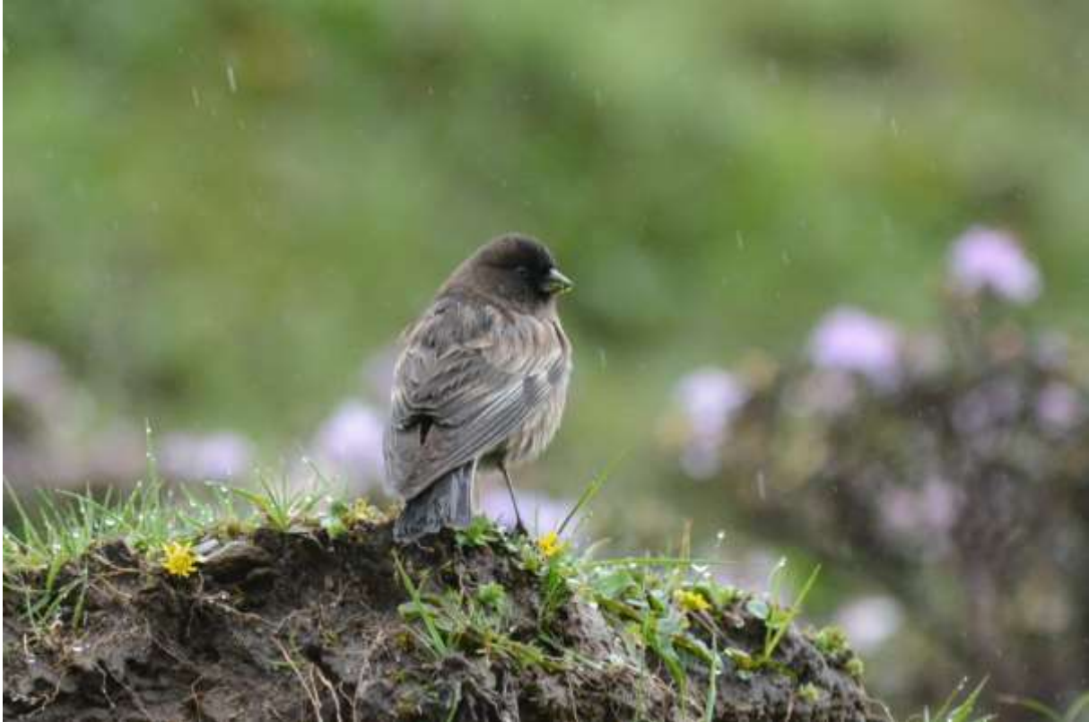
Brandts Mountain-Finch, Balang Pass, Sichuan, China, 10 juni 2014, LS