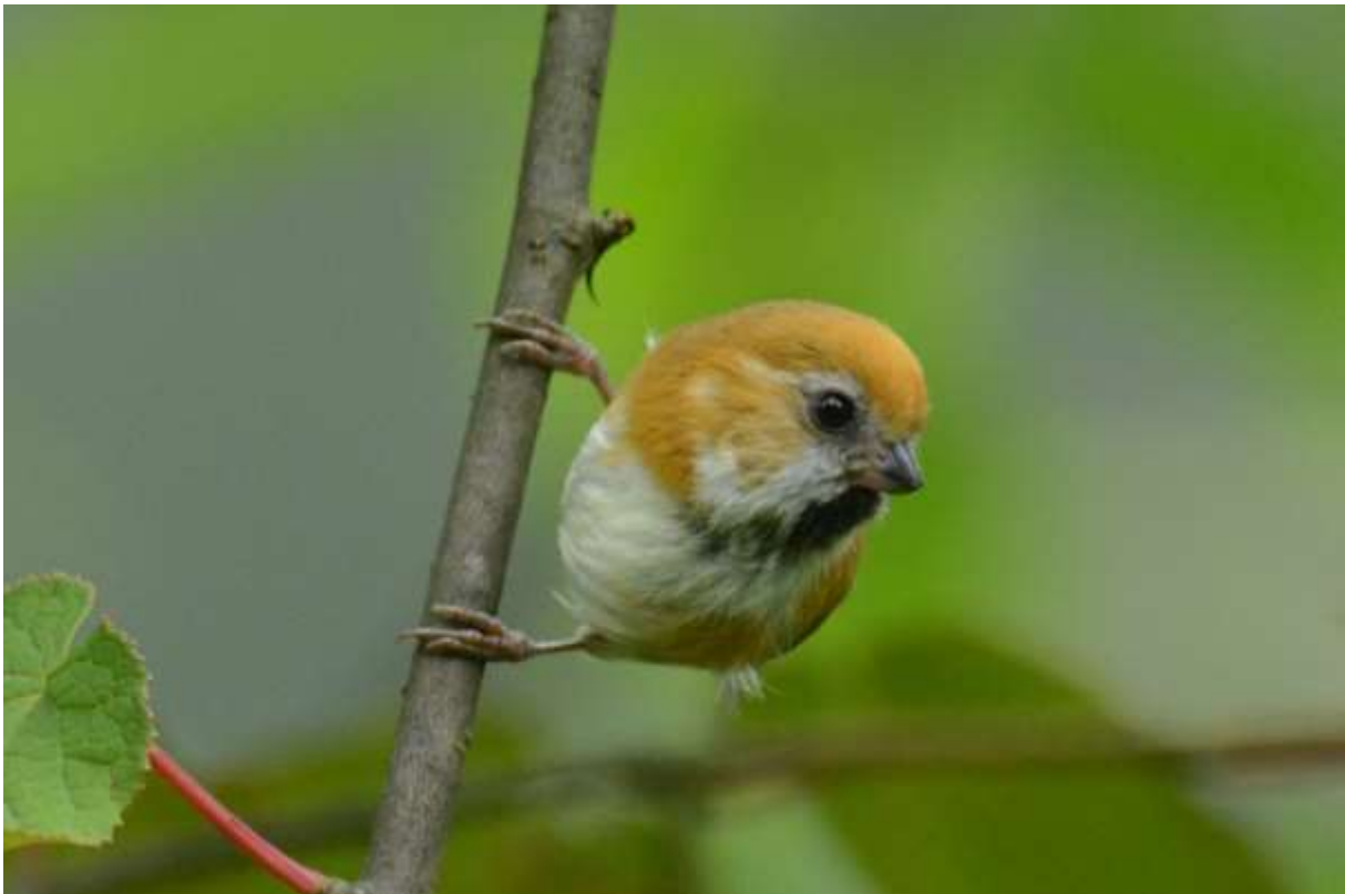
Golden Parrotbill, Longcanggou, Sichuan, China, 6 juni 2014, LS