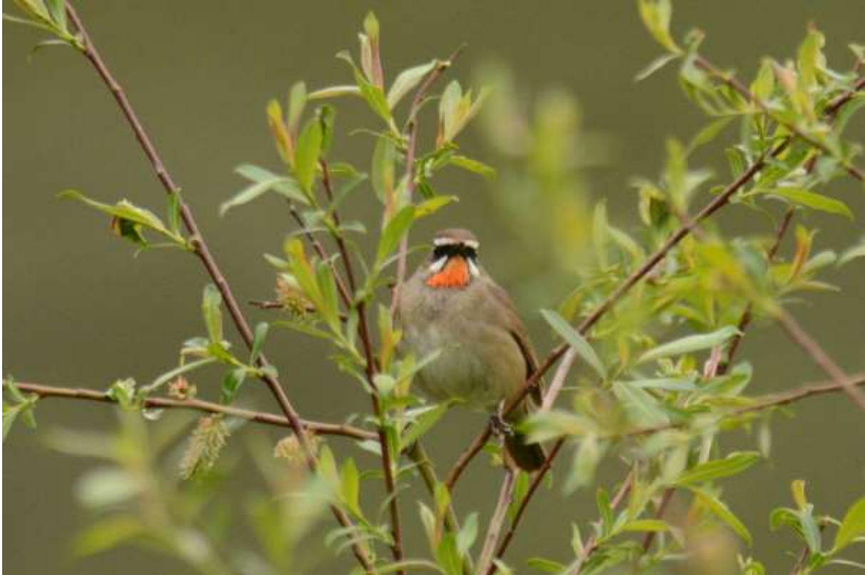
Siberian Rubythroat, Baxi Forest, Rouergai, Sichuan, China, 14 juni 2014, LS

Toen we vervolgens de verre heuvels gingen scannen vonden we twee erg verre Blue-eared Pheasants, yes!! De vogels zaten op een open plek in het bos en konden met de telescoop op een maximale vergroting uiteindelijk goed bekeken worden. De bus bleek ondertussen vast te zitten in het gras door een mislukte draai-actie van de chauffeur.... Stenen en takken voor extra grip mochten niet baten en uiteindelijk was het een vrachtwagenchauffeur die redding bracht terwijl onze chauffeur achter de bus aanrende, komisch!