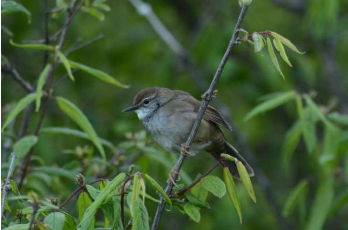
Spotted Bush-Warbler bij Gonggangling

hoorde bij de parkeerplaats. Even later zat ie prachtig bovenin de longen uit zijn kleine lijf te zingen! Het werd even later erg lawaaïg door alle touringcars dus we besloten om op een andere plek nog wat te vogelen. Dichter bij de pas vonden we een mooi pad waar we een korte wandeling maakten. Eindelijk stierf het lawaai van de bussen langzaam uit. We zagen Himalayan Bluetail, Tibetan Siskin, enkele Roodmussen en Siberische Boompiepers, Rufous-vented Tit en nog enkele Beautiful Rosefinches. Toen was het tijd geworden om de lange terugtocht naar Chengdu te aanvaarden. Het duurde echter nog geen 2 uur voordat we in de file terechtkwamen. Een vrachtwagen bleek van de brug gereden te zijn. Alles stond potdicht en twee rijen dik....flinke vertraging dus. Na een tijdje werd er een andere brug gebruikt waar langzaam al het verkeer over heen kon rijden en loste de file gelukkig op. Geen tijd meer om onderweg te vogelen dus we kamen laat in de middag aan in het hotel in het mooie stadje Dujiangyan waar we ook overnachten. Een mooi restaurant met een heerlijk avondmaal en een borrel in een lokale kroeg was een prachtige en gezellige afsluiter.