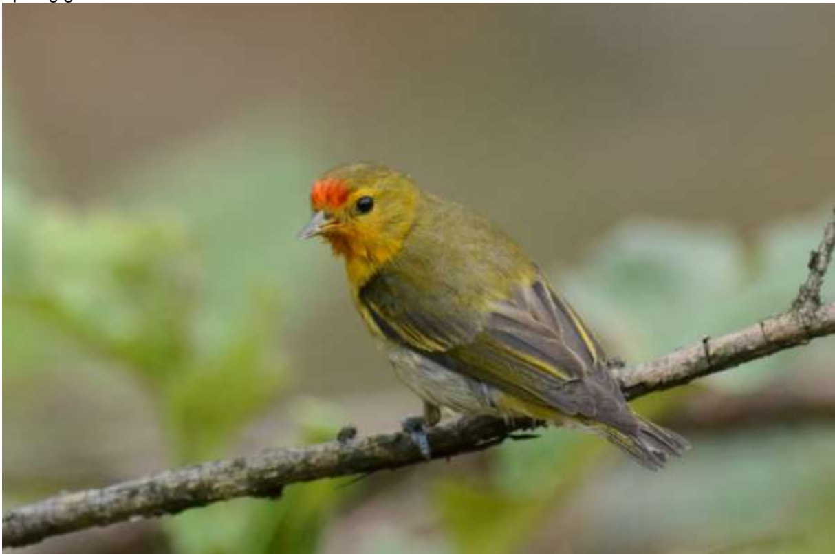
Fire-capped Tit, Longcanggou, Sichuan, China, 6 juni 2014, LS

Large-billed Leaf Warbler en Mrs Goulds Sunbird lieten zich fraai fotograferen. De middag werd in het lager gelegen deel doorgebracht. En dat begon goed met een paar prachtige Golden Parrotbills, wat een schitterende vogels! De trail in het laagste deel van het park was prachtig met een boardwalk over en langs een snelstromende rivier met watervallen. De doelsoort hier was Emei Shan Leaf Warbler die hier nog maar sinds kort bekend is. Onderweg was het goed vogelen met Chinese Blue Flycatcher, Orange-bellied Niltava en nog meer Golden Parrotbills. Op de plek aangekomen hoorden we al snel