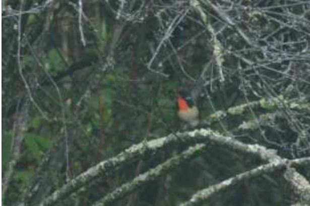
Firethroat, Wolong, Sichuan, China, 9 juni 2014, LS

helling hoorden we een vogel zingen dus we klauterden naar het hoogste punt voor de beste kansen. De vogel zong nog steeds af en toe en toen Jay de Blackthroat even speelde kwam ie tevoorschijn aan de buitenkant van een struik op de helling. Wauw! Wat een beest zeg!