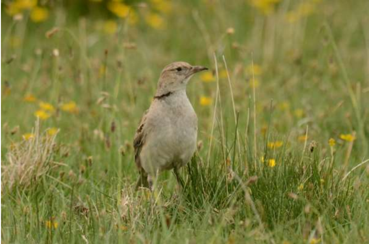
Tibetan Lark, Flower Lake, Rouergai, Sichuan, China, 14 juni 2014, LS

We waren ineens ook een Chinese toeristische attractie want de groep werd uitgebreid op de foto gezet terwijl we de leeuweriken aan het bekijken waren! Pacific (Salim Ali) Swifts vlogen laag over het water en lieten zich zeldzaam mooi zien en fotograferen. Inmiddels was het flink aan het regenen en op de boardwalk naar de volgende hut liet een Strandleeuwerik zich nauwelijks van het pad jagen. De terugweg met de shuttlebus naar de parkeerplaats had nog een verrassing in petto: Benny zag een Saker op een van de paaltjes langs de weg! Toen we er eindelijk uit konden was ie met de scoop nog goed herkenbaar, teruglopen was echter niet mogelijk. De omgeving was prachtig met uitgestrekte rietvelden en graslanden, besneeuwde bergtoppen en Tibetaanse tempels. Overnachting in Ruergai.