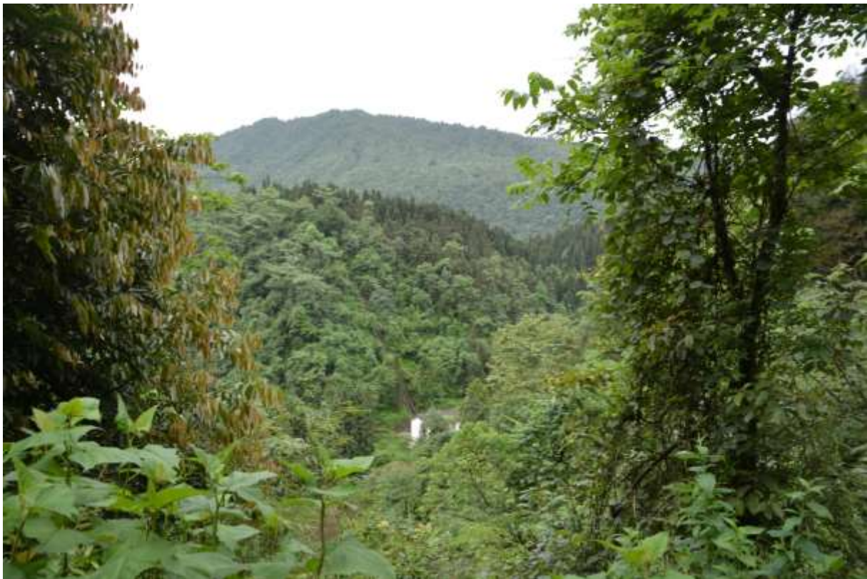
Longcanggou park, Sichuan, China

Vroeg op en met donker het park in zodat we met het eerste licht op locatie zijn. Omdat er werkzaamheden zijn in het park was de gate normaal gesloten voor gemotoriseerd vervoer. We zouden echter toch vroeg naar binnen kunnen maar door miscommunicatie was de bewaker bij de entree hier niet van op de hoogte. Dus maar ontbijten bij de gate en vervolgens al wandelend het park in. We hoorden al snel veel vogels in het dichte gebladerte maar het duurde even voordat we de eerste soorten zagen. Toen Jay Collared Owlet afspeelde werden veel soorten zichtbaar met onder meer veel zangvogels zoals Chestnut-crowned, Claudia's (split van Blyths) Warbler, Yellow-bellied en Green-backed Tit en Red-billed Leiothrix. Het afspelen van de Collared Owlet werd al snel gemeengoed en verderop langs de trail werden Chestnut-vented Nuthatch, Black-browed Tit, Mrs Goulds Sunbird, White-collared en Stripe-throated Yuhina gezien. Toen kwam het bericht dat de gate open was dus snel naar de bus om omhoog te rijden. Het is voornamelijk een bergbosgebied, doorsneden met rivieren. Je kunt tot een hoogte van ongeveer 2000 m rijden en onze eerste stop was rond 1800m. We leerden de zang kennen van Large-billed en Eastern Crowned Warbler die hier beiden algemeen zijn.