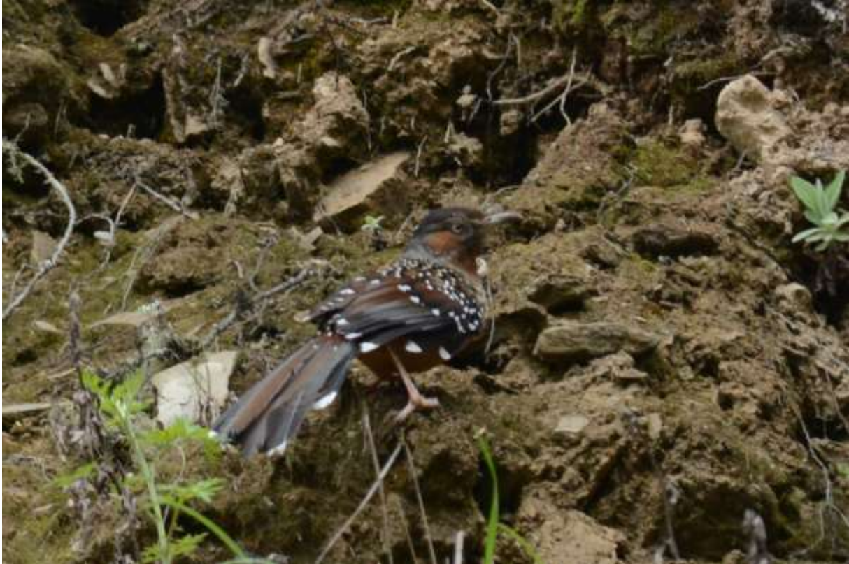
Giant Laughingthrush, Wolong, Sichuan, China, 8 juni 2014, LS

verdwijnen. De wandeling was zonder meer prachtig maar de vogels lieten het een beetje afweten. We hoorden een Maroon-backed Accentor en zagen de bekende soorten dus we besloten om wat verder af te zakken. Firethroat is dé soort die je bij Wolong moet doen en bij de volgende stop hoorden we er zowaar een zingen in de dichte begroeide helling! We speelden het geluid af maar echt dichterbij kwam de vogel niet. Jeroen zag de vogel echter kortstondig zitten, maar hij bleef de enige. Het afspelen van Collared Owlet was hier overigens een waar feestje met Buff-barred, Hume's, Sichuan, Eastern Crowned en Greenish Warbler, allen op c 10 meter afstand en op ooghoogte, erg leerzaam! Een Bianchi's Warbler liet zich hier ook kort zien terwijl een Aberrant Bush-Warbler zich op enkele meters prachtig liet fotograferen.