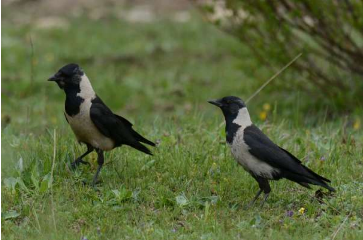
Daurian Jackdaw, Tibetaans Plateau, Hong Yuan, Sichuan, China, 11 juni 2014, LS

Een langsvliegende Grote Zaagbek was opmerkelijk. In de lage begroeiing langs de rivier zagen we twee Plain Laughingthrushes. Na al dit geweld reden we langzaam verder naar Hongyuan door steeds uitgestrektere graslanden met meanderende rivieren. Jeanette zag de eerste Black-necked Crane, en dat waren er meteen 8! Ze zaten dicht langs de weg en waren prachtig te zien en te fotograferen. Plotseling riep Jay dat ie mogelijk een uil had gezien, bus dus stoppen en even teruglopen. Een daar zat inderdaad een prachtige Oehoe op nog geen 40 meter afstand! De vogel werd uitgebreid bekeken en gefotografeerd. Hij was een stuk bleker dan die in Europa. Andere soorten tot aan Hongyuan waren Casarca, Frater, Hop, verschillende Upland Buzzard en maar liefst 30 Koekoeken. Het hotel en het eten in Hongyuan waren uitstekend.