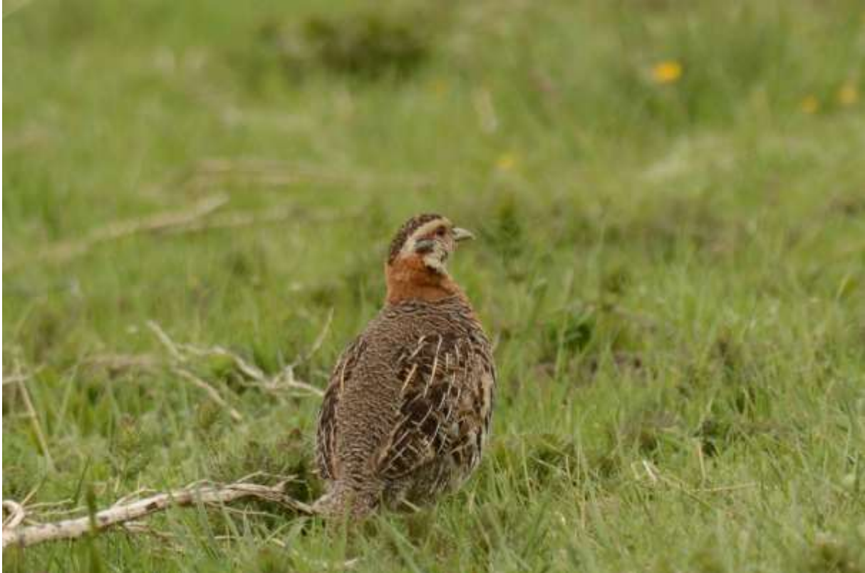
Tibetan Partridge, Tibetaans Plateau, Hong Yuan, Sichuan, China, 12 juni 2014

Daar geen patrijzen meer maar wel een Tibetan Grey Shrike. We sloten de dag af met een wandeling door wat lage begroeiing voor zangvogels en in het bijzonder Robin Accentor en White-browed Tit-Warbler. Helaas geen van deze soorten maar wel late trekvogels in de vorm van Black-capped Kingfisher en Brown Shrike. Verder zagen we nog een Tibetan Grey Shrike, Yellow-streaked Warbler en een Hog Badger. Overnachting was in het opmerkelijke plaatsje Rouergai waar we een prima hotel hadden met dito restaurant.