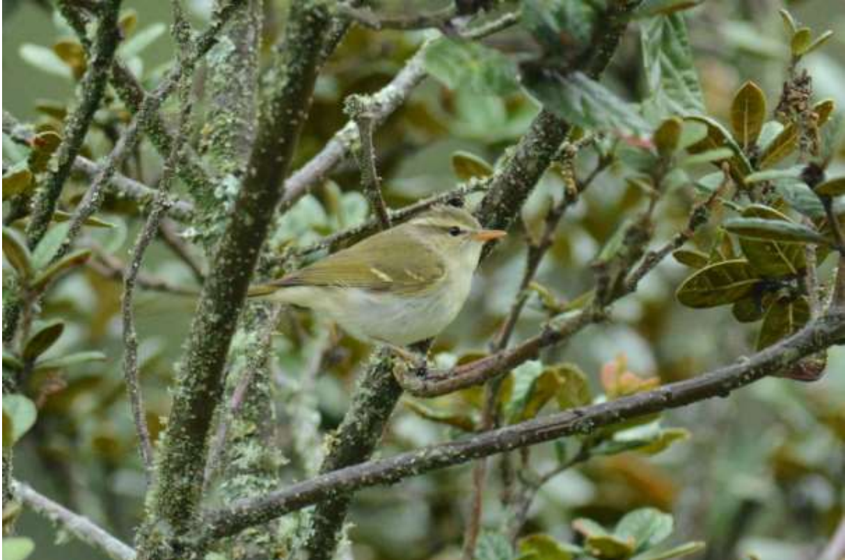
Eastern Crowned Warbler, Wolong, Sichuan, China, 8 juni 2014, LS

Even later kwam er op ooghoogte een schitterende Himalayan Griffon Vulture langsvliegen die een minuten durende show weggaf, schitterend! De laatste stop van de dag was bij de Lama tempel bij Wolong. Het begon hier al meteen goed met een Daurian Redstart en een Chinese Leaf Warbler. Het begon langzaam wat te regenen en langs het karrespoor omhoog zagen we Yellow-streaked Warbler en hoorden we Slaty-backed Flycatcher zingen in de sparren. We besloten om een tijdje te posten langs een vallei met goed uitzicht voor Chinese Babax en Barred Laughingthrush, we hoorden beide soorten maar ze lieten zich uiteindelijk niet zien. Het afspelen van Collared Owlet bracht wel wat activiteit in de vorm van Grey-crowned Warbler, enkele Buff-throated Warblers en Collared Finchbills. Dit was ook de plek van de Goudfazant en Jay liet ons het veld zien waar ze regelmatig fourageerden. Ineens riep hij dat ie er een zag lopen en al snel zagen we 2 mannetjes en een vrouwtje Goudfazant! Wauw! Wat een onwaarschijnlijke vogels! Dit was absoluut een bonus want veel groepen horen ze alleen of zien kort een vrouwtje langs de weg lopen. Deze lieten zich minutenlang door de telescoop bewonderen. De regen werd steeds heftiger en we besloten om naar het hotel te gaan in Wolong waar het bier en het eten goed smaakte.